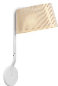
Owalo 7030 height 47 cm depth 33 cm width 7 cm base Ø 12 cm