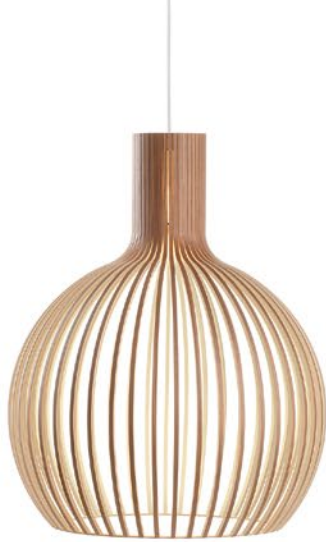
Octo 4240 height 68 cm Ø 54 cm