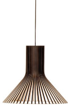
Puncto 4203 height 40 cm Ø 45 cm