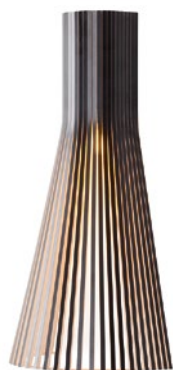
Secto 4230 height 60 cm Ø 30 cm