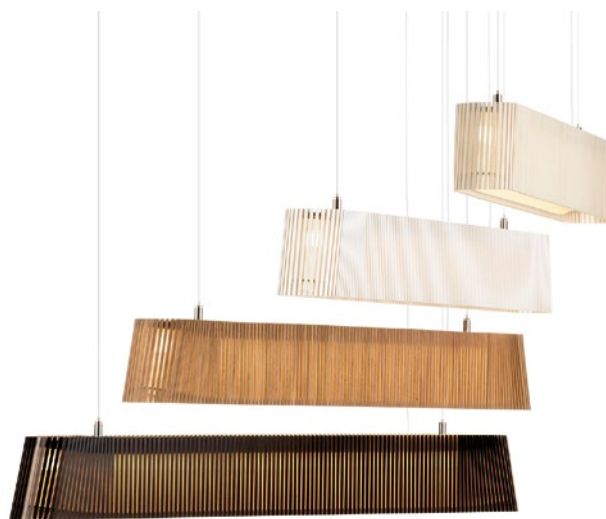
Owalo 7000 height 13 cm length 100 cm width 9 cm