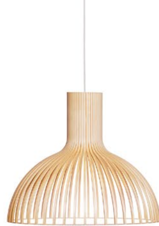
Victo 4250 height 48 cm Ø 56 cm