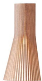
Secto 4231 height 45 cm Ø 25 cm