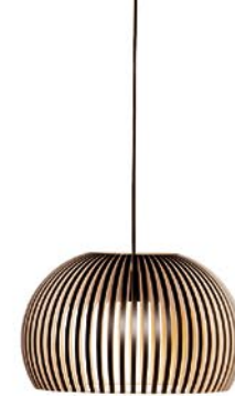
Atto 5000 height 21 cm Ø 34 cm