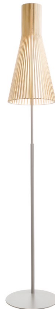
Secto 4210 height 175-185 cm base Ø 30 cm