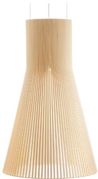
Magnum 4202 height 87 cm Ø 56 cm