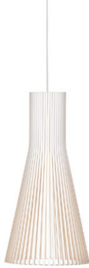
Secto 4200 height 60 cm Ø 30 cm