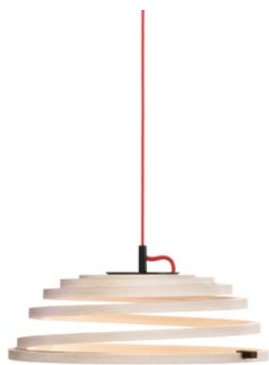
Aspiro 8000 height ~25-35 cm Ø 50 cm