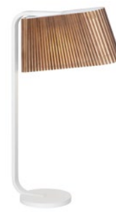
Owalo 7020 height 50 cm depth 30 cm width 7 cm base Ø 13 cm