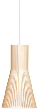
Secto 4201 height 45 cm Ø 25 cm