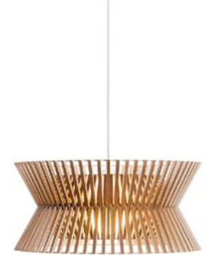
Kontro 6000 height 21 cm Ø 45 cm