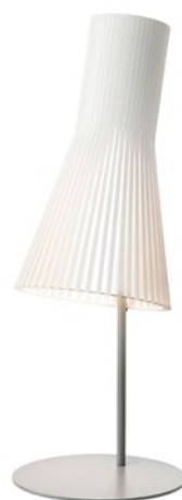
Secto 4220 height 75 cm base Ø 25 cm